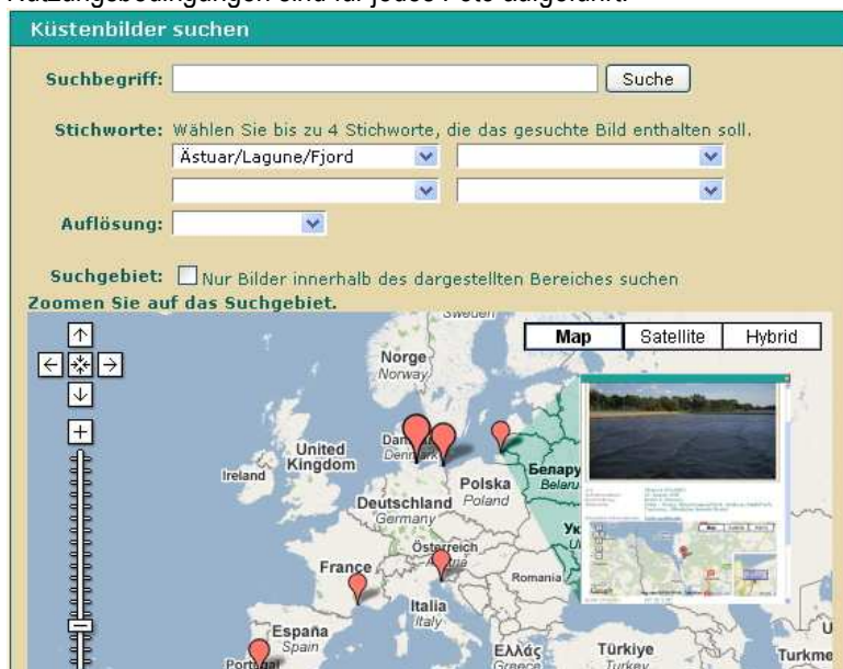
Abbildung: Beispiel für ein Suchanfragefenster mit verkleinertem Ergebnisbild

Küstenbilder aus der ganzen Welt und zu den verschiedensten Themen werden von angemeldeten Benutzern in eine Online-Datenbank eingestellt. Die Fotos werden vom Einstellenden selbst verschlagwortet und mit Hilfe eines Google-Maps-Elements direkt dem konkreten Ort in der Weltkarte zugeordnet. Die Aufnahmen stehen jedem für die nicht-kommerzielle Nutzung zur Verfügung. Die jeweils gültigen Nutzungsbedingungen sind für jedes Foto aufgeführt.